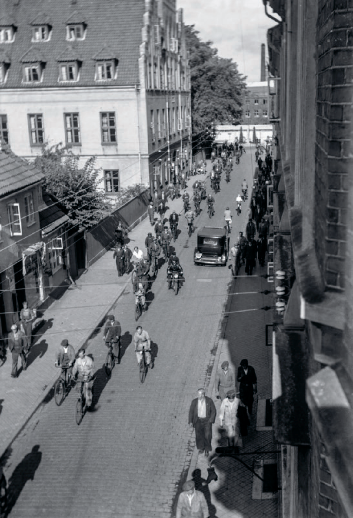
Fig. 7 Op til 3.500 af byens borgere arbejdede på Helsingør Skibsværft i 1950-70'erne.